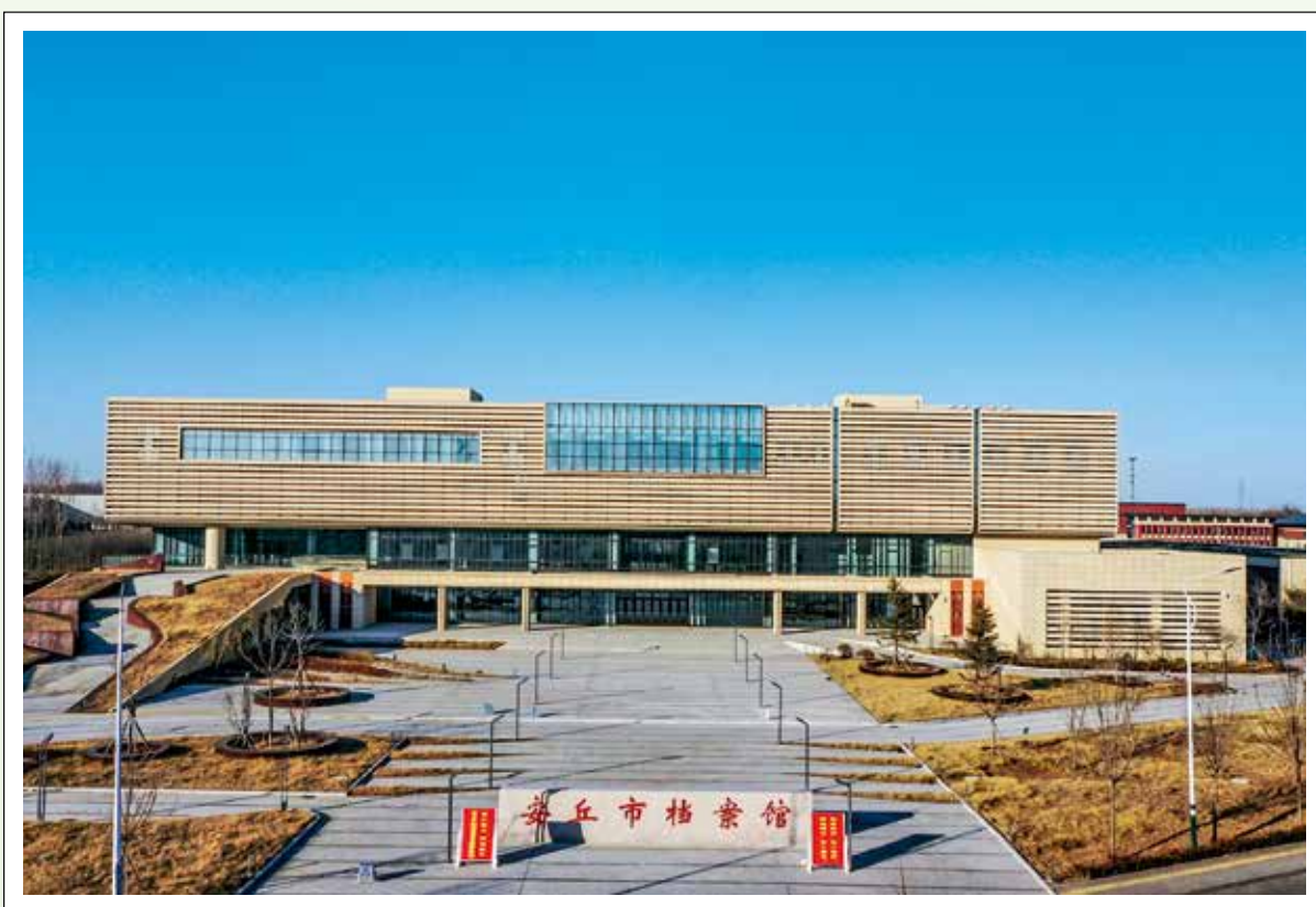
新建成的安丘市档案馆