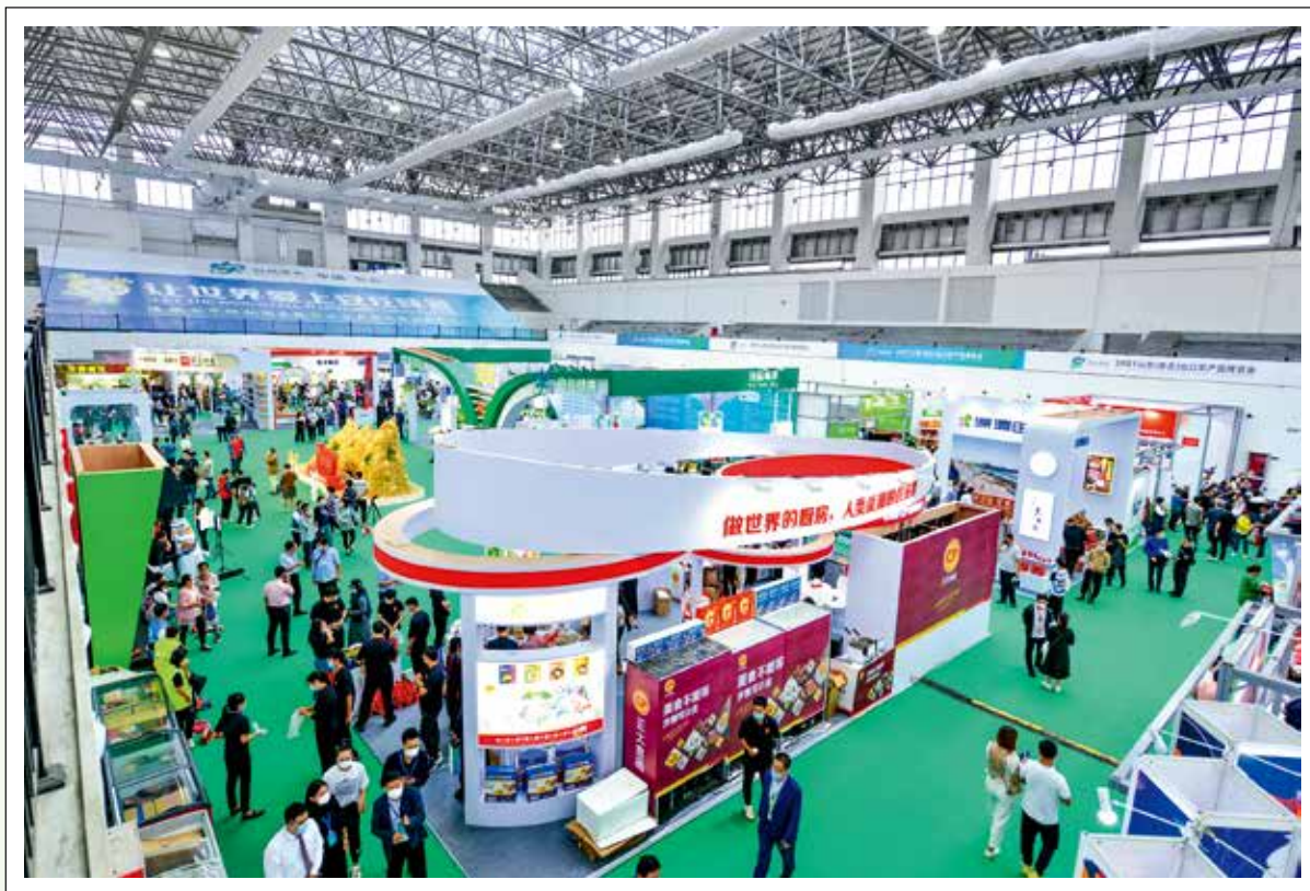
2021 山东（安丘）出口农产品博览会