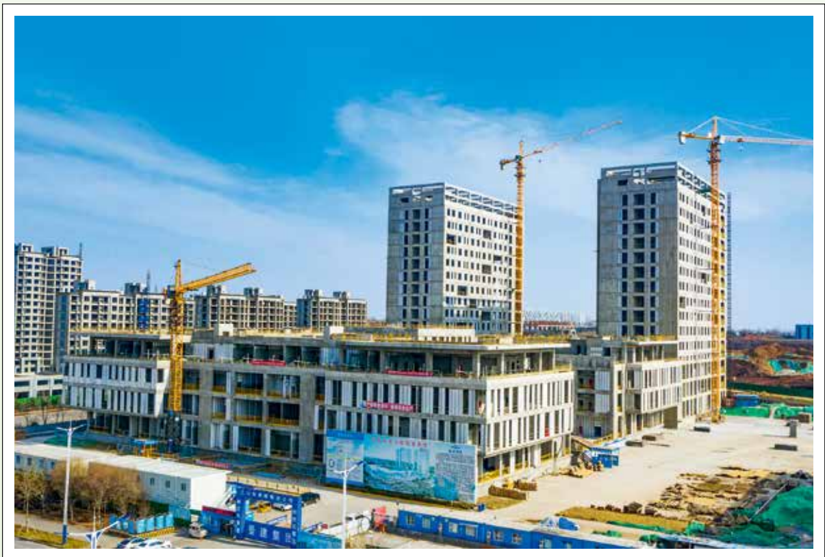
在建新安丘市市立医院