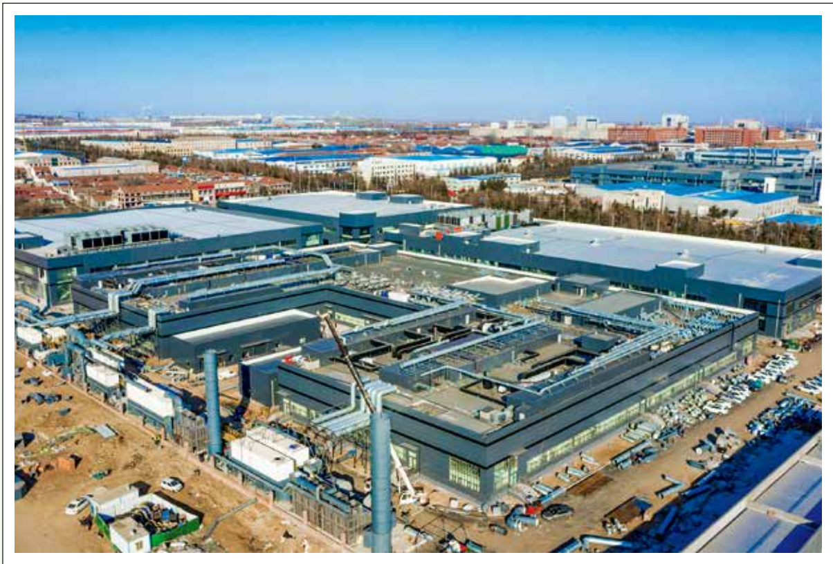
安丘市怡力智能产业园基础设施及加工制造项目