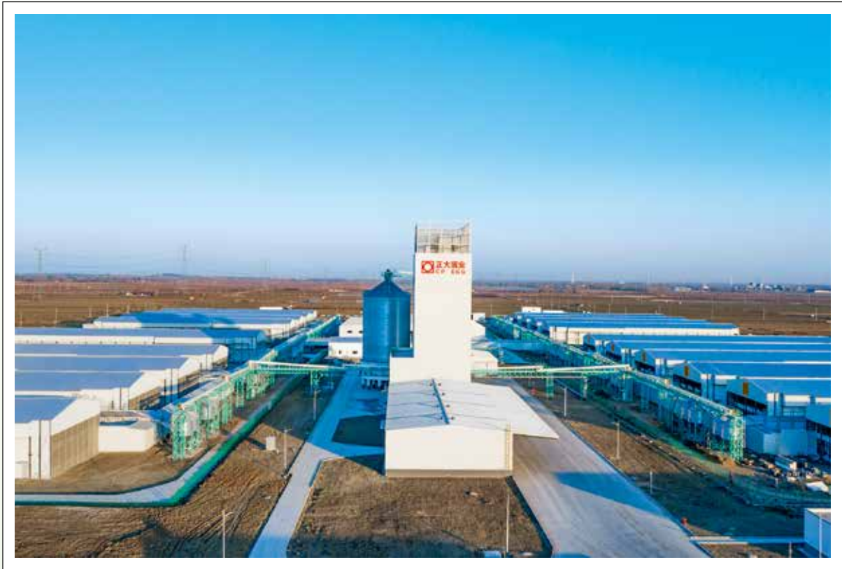
正大潍坊现代食品（360万蛋鸡）全产业链项目