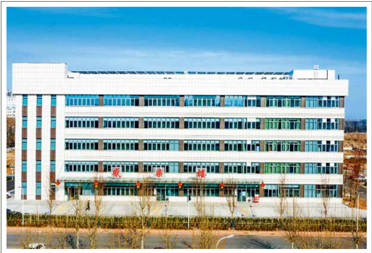
新建成的安丘市人民医院感染楼