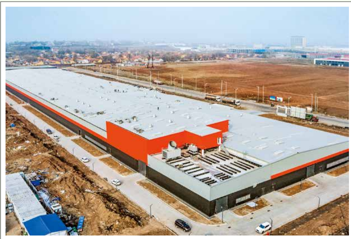
年产100万吨今麦郎饮品生产线建设项目