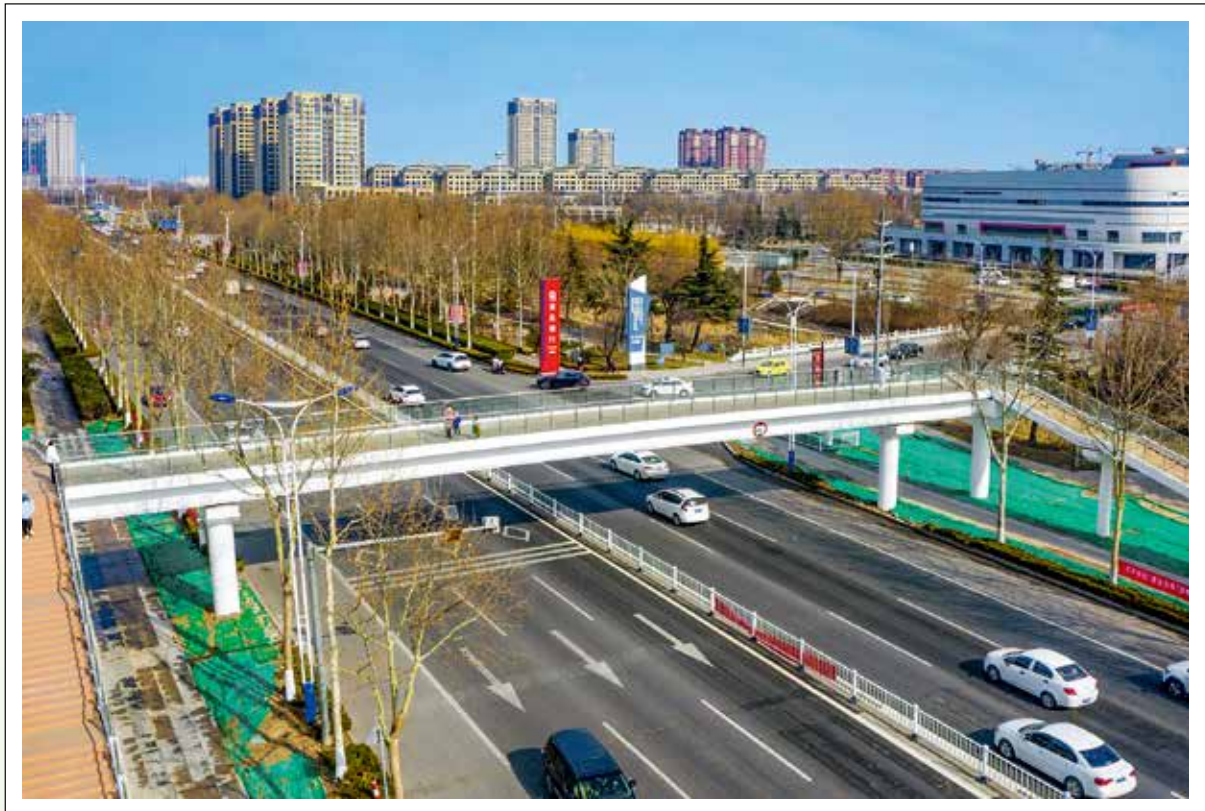
安丘市首座新安路过街天桥