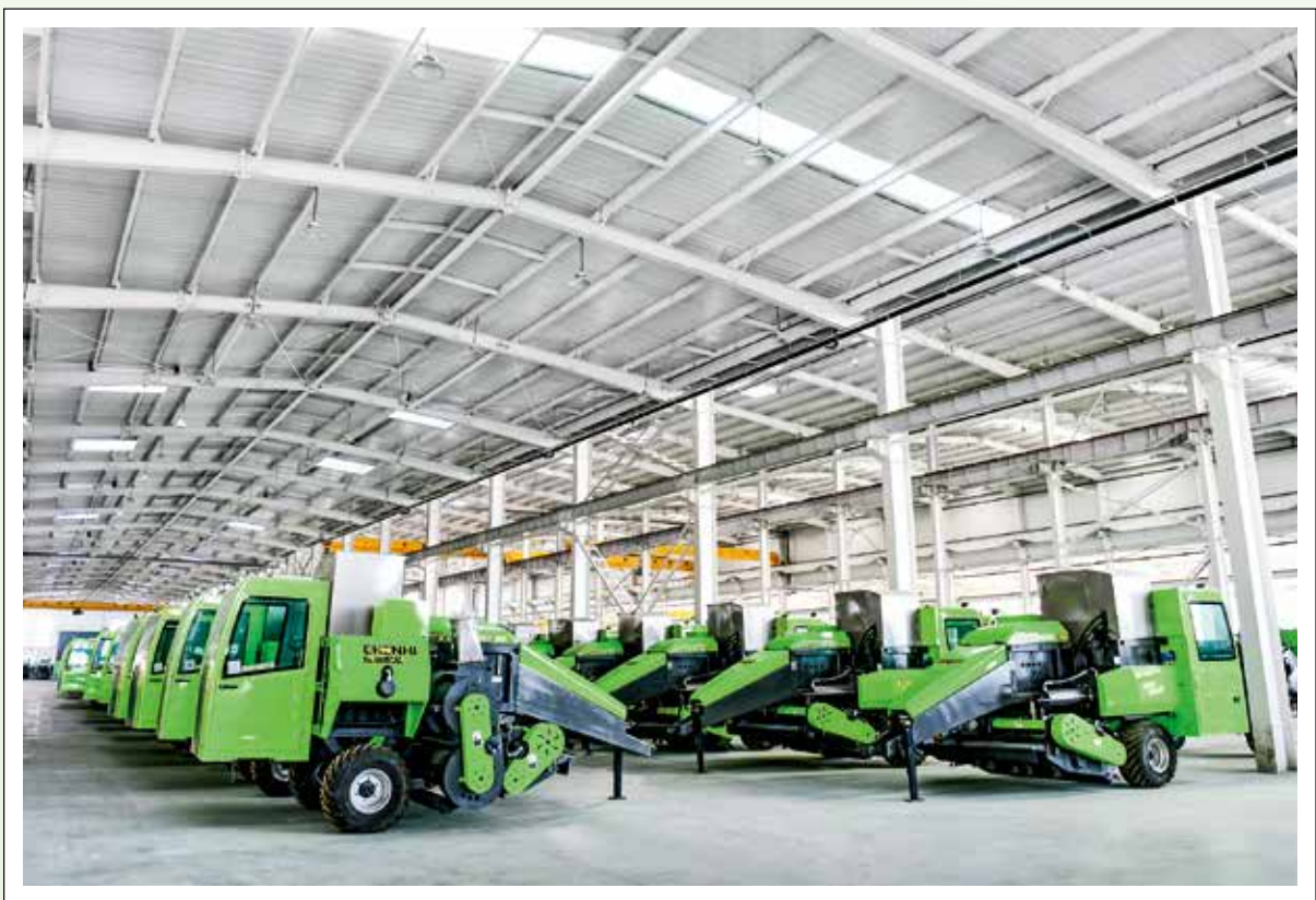
安丘鑫凯高端智能设备产业基地生产车间