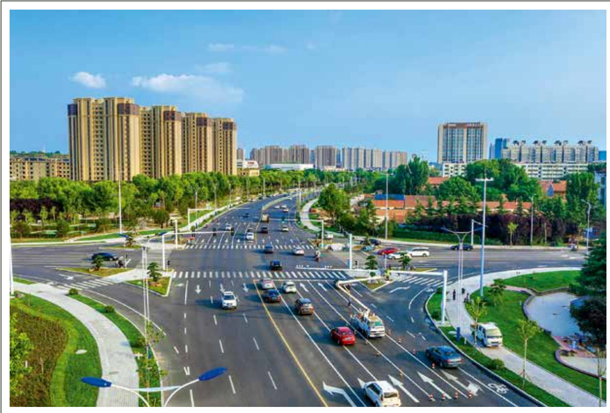
原贾戈立交桥改造后实景