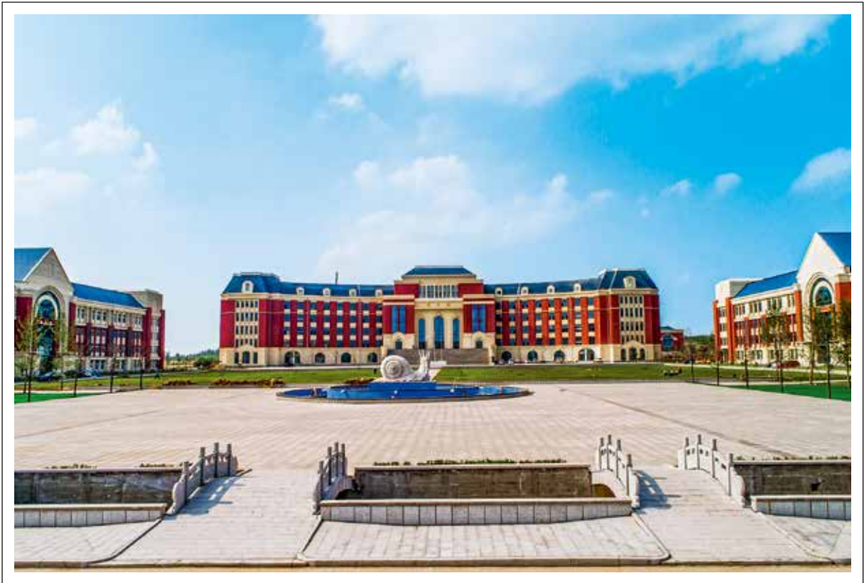
山东食品科技职业学院建成