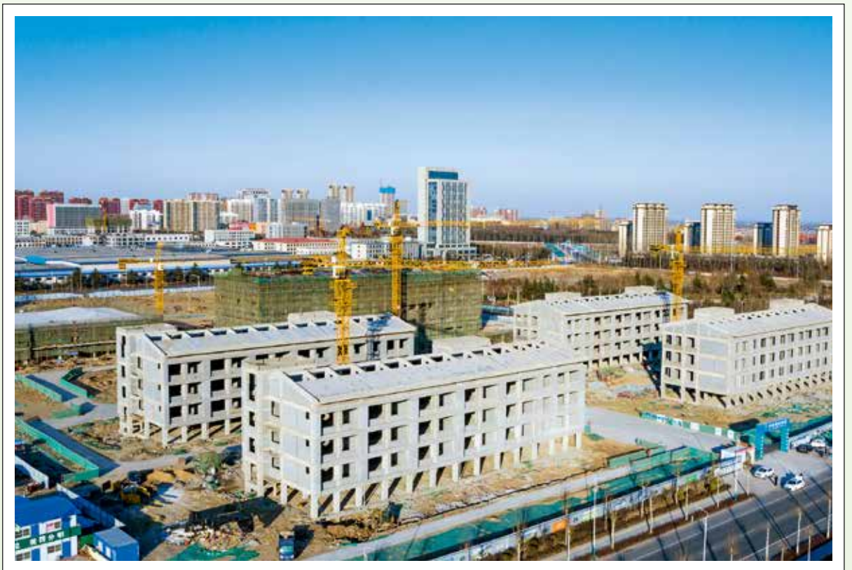
青云湖学校在建项目