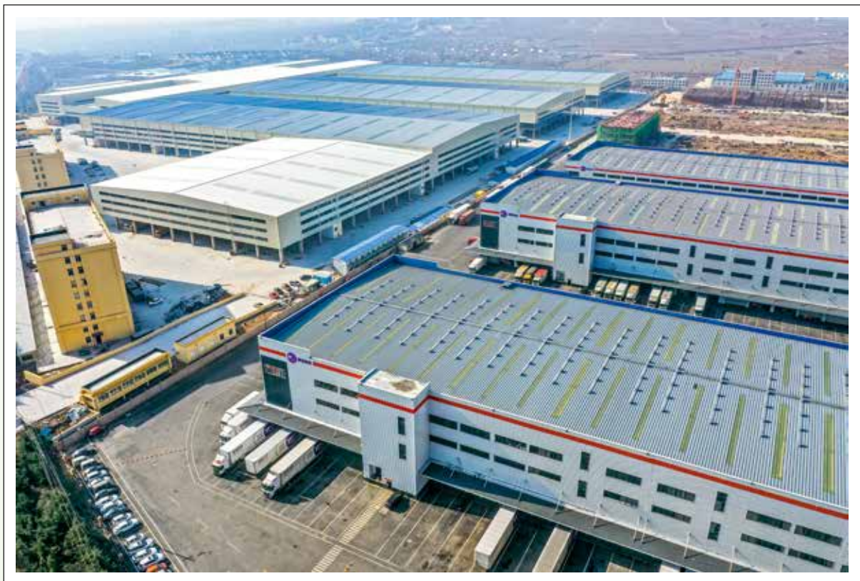
圆通胶东半岛区域总部基地项目和韵达山东（安丘）快递电商总部基地项目